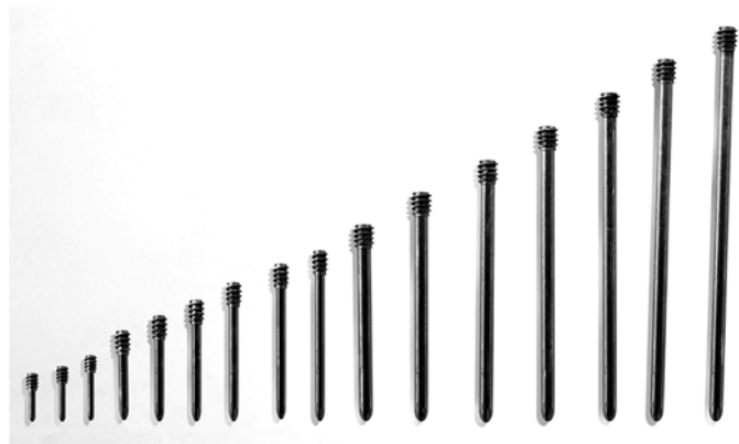
Рис. 1. Набор электретных стимуляторов остеорепарации (ЭСО) (ТУ 9438-001-50843519-2015) для любых суставов

(+ на Та), в соответствии с выражением d = \alpha U , где \alpha = 1,5...1,7 нм/В [19] – коэффициент, определяемый условиями окисления. Величину поверхностной плотности заряда АО определяли по выражению \sigma = \epsilon \epsilon_0 U_s / d , где \epsilon = 27,6 – диэлектрическая проницаемость АО Та; \epsilon_0 = 8,85 \cdot 10^{-12} Ф/м – электрическая постоянная; U_s – электретная разность потенциалов между внешней поверхностью АО и танталом.